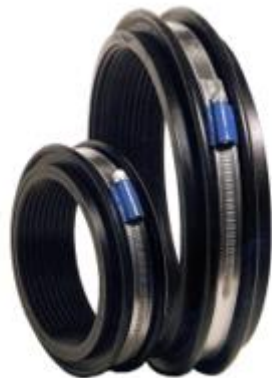
Tetningsring / gummiring

Det monteres en tetningsring/gummiring rundt PVC-U røret ved rørgjennomføring i kumvegg.