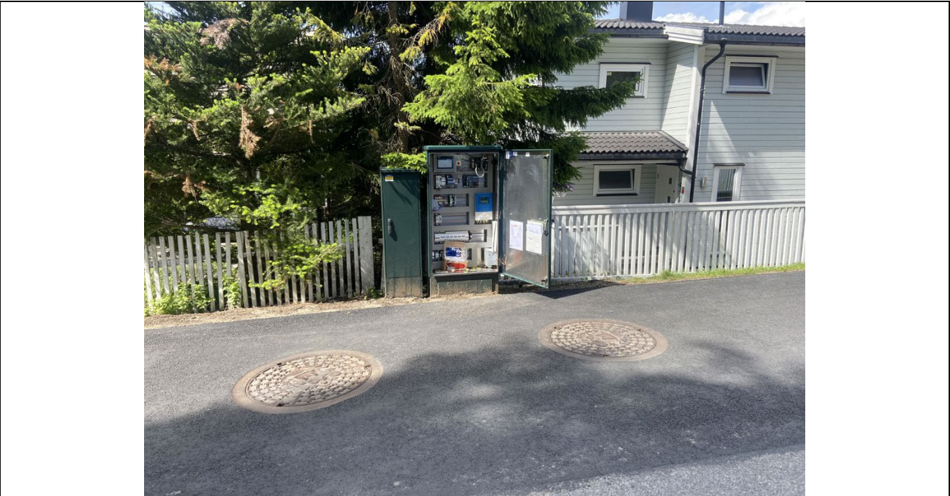
Tilknytningsskap med EL-skap